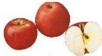
Apples of New York, 1905, Sa Beach.

IL existe une Reinette du Canada Rouge : vues de 1905, USA.